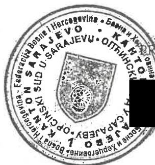
PREDsjedNIK SUDA Damir Batotić